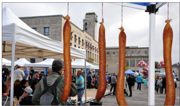
La première fête du cochon, l'an passé, avait déjà suscité la polémique, mais avait obtenu un vif succès.

Prévue à Hayange le 6 septembre, la 2e édition de la fête du Cochon, « populaire et traditionnelle », selon le maire FN, réveille les polémiques.